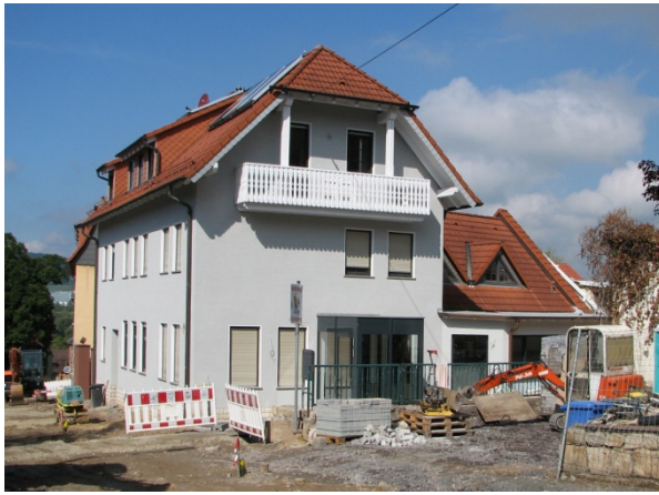
Die zukünftige Arztpraxis Susanne-Bohl-Str. 16 währendes Umbaus 2015; Foto: Claus Nötzold