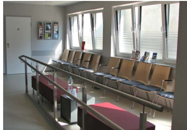
Der Wartebereich der neuen Praxis

Seit 1995 hat die Computertechnik auch in der medizinischen Praxis Einzug gehalten und führt zur weitgehender Digitalisierung der Patientenkartei und dem Abrechnungsbereich. Der in der DDR übliche SVK-Ausweis wurde durch die Patientenchipkarte ersetzt.