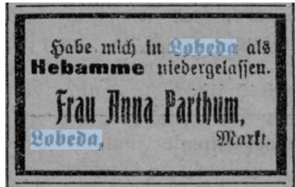
Anzeige im Jenaer Volksblatt 26.02. 1913

Nach dem 1. Weltkrieg war der Bedarf an Krankenpflege besonders groß. Auf Anregung der Landesversicherungsanstalt Thüringens sollten Schwesternstationen eingerichtet werden. In Burgau war bereits 1918 eine solche Schwesternstation entstanden. Lobeda als Oberzentrum wollte dem nicht nachstehen und bemühte sich ebenfalls um eine Schwester. Die Finanzierung sollte durch den neu gegründeten Gemeindepflege-Verband Lobeda gesichert werden, dem bereits 1919 alle Familien bis auf 30 beigetreten waren. Der Mindestbeitrag war 2 Mark jährlich und konnte durch Spenden beliebig aufgestockt werden. /17/