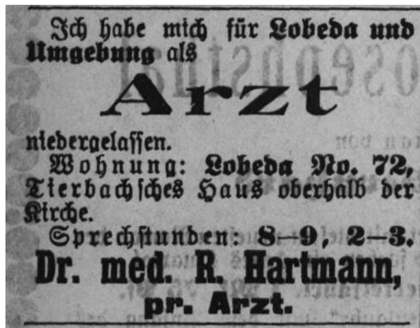
Anzeige im Jenaer Volksblatt vom 2. Juli 1898