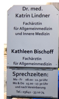
Praxisschild 2017

Die Arztkosten übernehmen bei den gesetzlich versicherten Kassenpatienten die Krankenkassen. Mitunter müssen geringe Zuzahlungen zum Beispiel bei Medikamenten gezahlt werden. Die Leistungen der zahlreichen Krankenkassen ist weitgehend gleich.