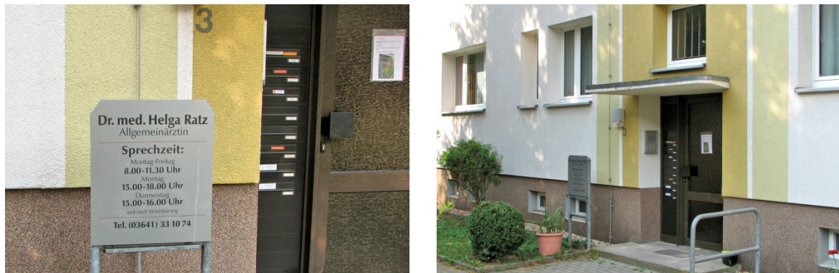
Die Arztpraxis Stadtgraben 3 im Jahre 2015; Fotos: K.-H. Donnerhacke

Durchschnittlich wurden 30 bis 40 Patienten täglich behandelt. Außerdem wurden, wenn nötig, Hausbesuche durchgeführt.