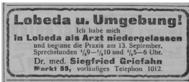
Anzeige im Jenaer Volksblatt vom 9. September 1922