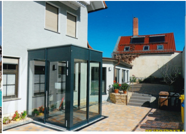
Die fertiggestellte Arztpraxis Susanne-Bohl-Str. 16 im August 2017