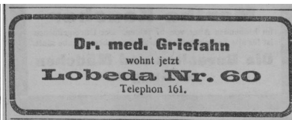
Anzeige im Jenaer Volksblatt vom 29. März 1924